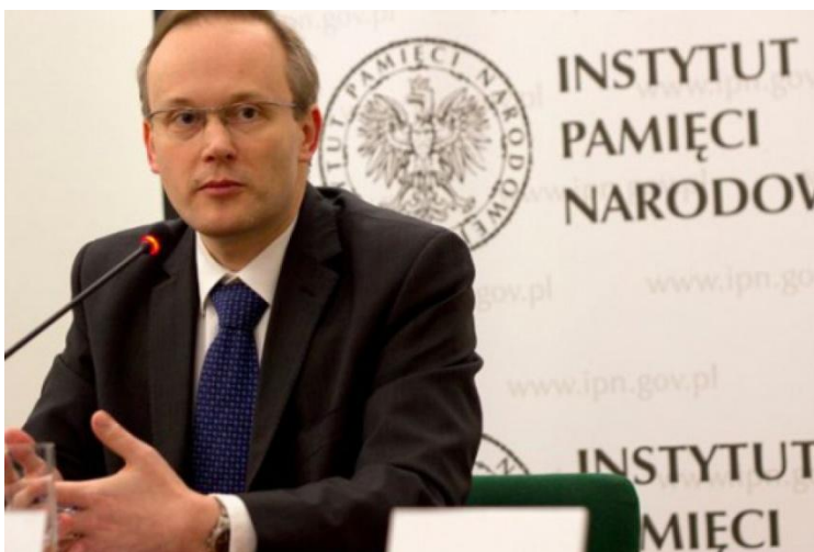
Łukasz Kamiński – prezes Instytutu Pamięi Narodowej

„Powszechna Deklaracja Praw Człowieka to nie tylko istotny dokument historyczny. Realizacja jej postanowień również dziś stanowi ważne wyzwanie. Nie możemy zapomnieć o masowym naruszaniu praw człowieka w XX wieku. Pamięć o nich nie tylko zapobiega powrotowi dyktatur, lecz uwrażliwia nas także na zło dziejące się współcześnie”.